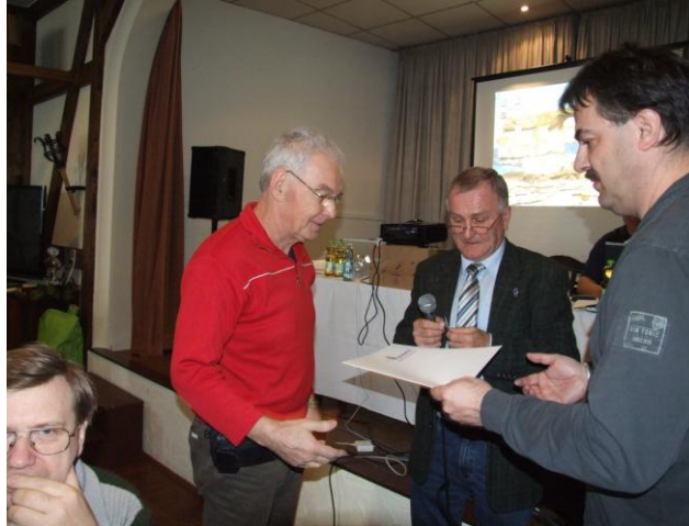
Ehrung 50 Jahre