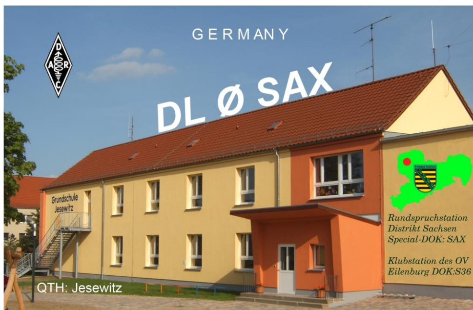
Rundspruchstation Distrikt Sachsen - QTH: Jesewitz (OV S36) - Schule Jesewitz -